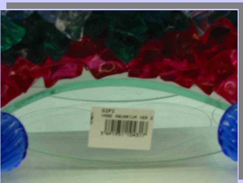
On peut lire "Vase aquarium" sur l'étiquette.

Hivers 2001, la série "aquariogag" continue. Pourquoi tuer la poule aux "Euros d'or"? Pour le troisième millénaire, il fallait innover. Et bien, voilà, il est arrivé le vase où l'on peut mettre devinez quoi ... des fleurs (trop simple) Mais oui, des poissons!!!!!!!!!!!!!! (encore des cadavres).